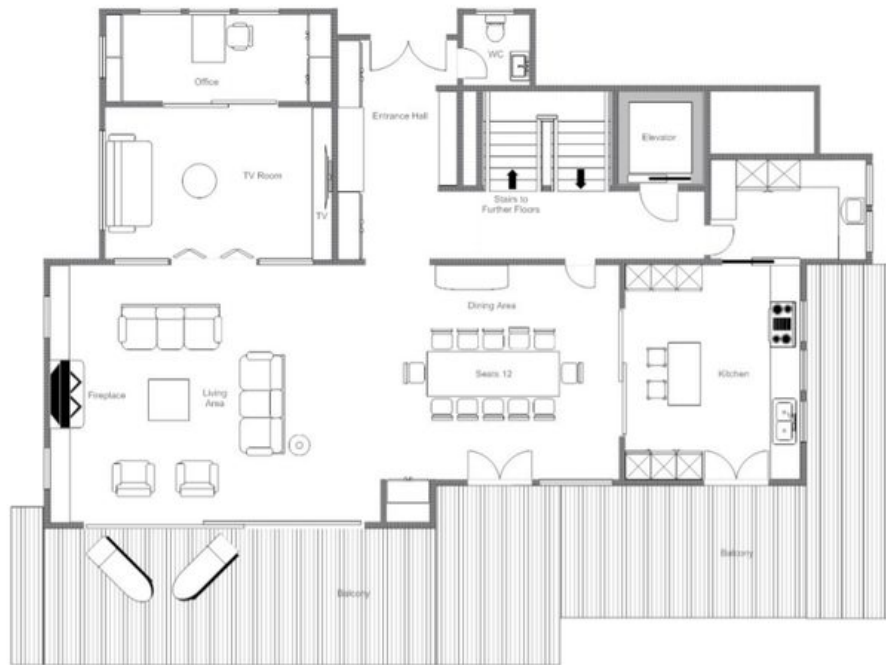
CHALET DENT BLANCHE - SECOND FLOOR, FOR ILLUSTRATION PURPOSES ONLY