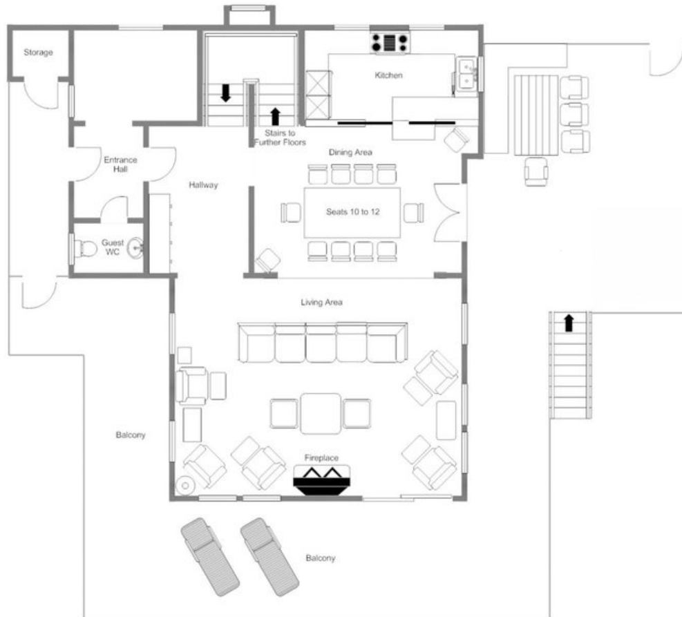
CHALET TESSELN - FIRST FLOOR, FOR ILLUSTRATION PURPOSES ONLY