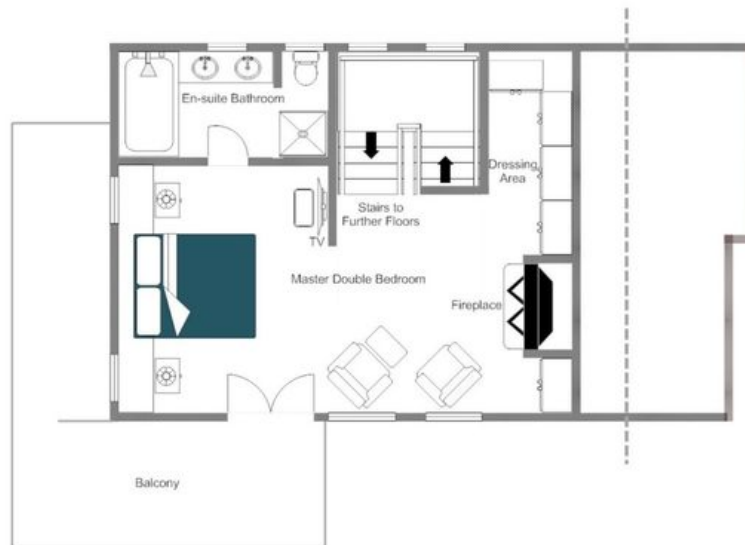
CHALET TESSELN - TOP FLOOR, FOR ILLUSTRATION PURPOSES ONLY