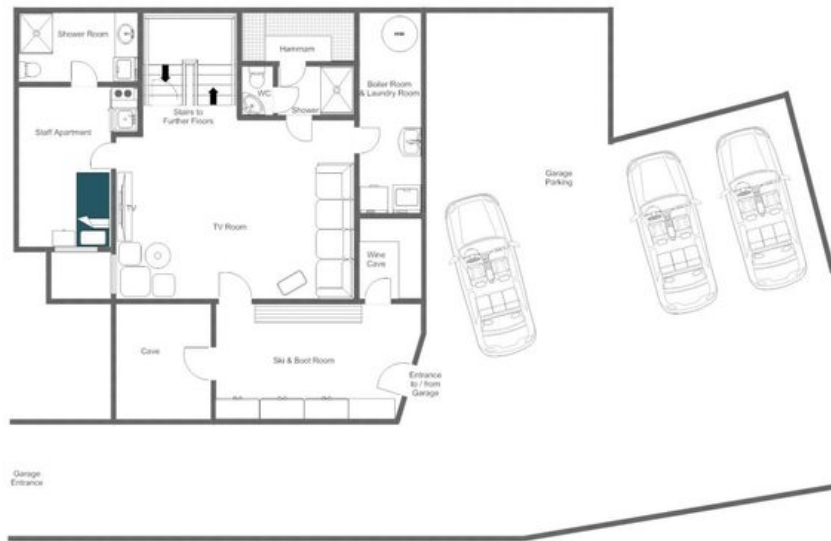
CHALET TESSELN - LOWER GROUND FLOOR, FOR ILLUSTRATION PURPOSES ONLY