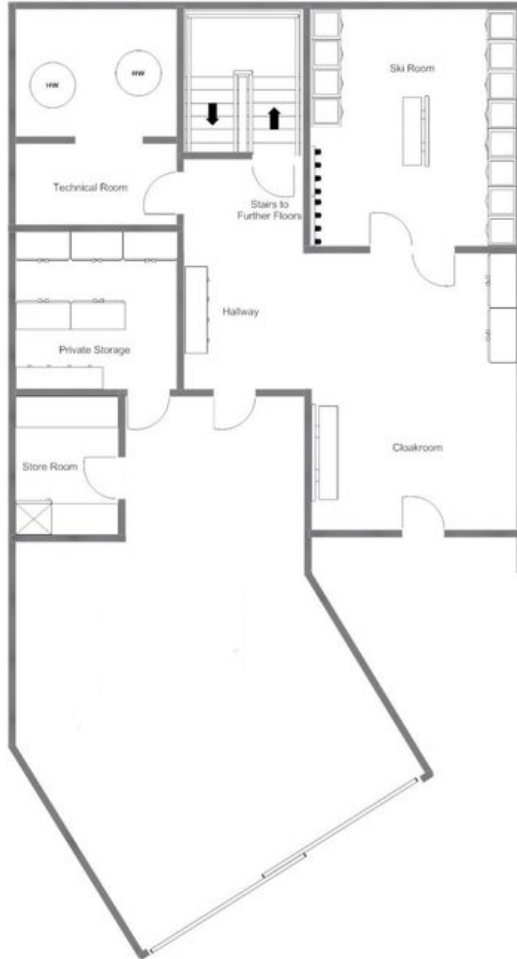
CHALET LES ETRENNES, ENTRANCE (GROUND) FLOOR - FOR ILLUSTRATION PURPOSES ONLY