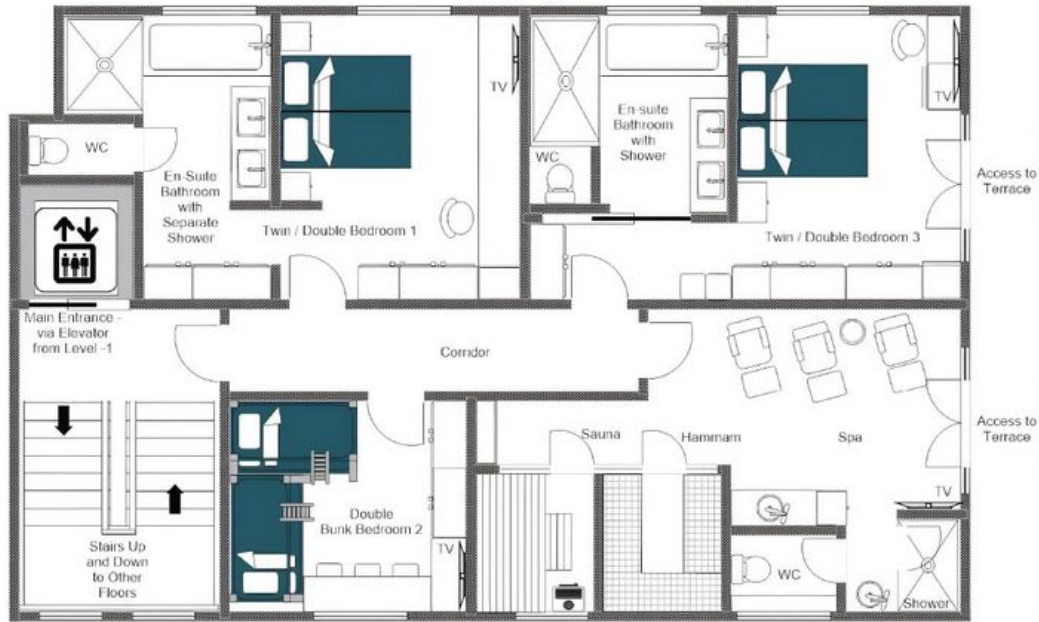
CHALECH M, GROUND FLOOR FOR ILLUSTRATION PURPOSES ONLY