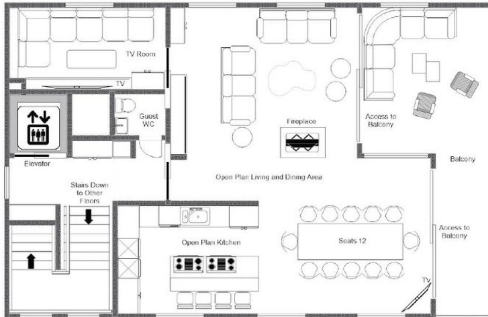
CHALECH M, TOP FLOOR FOR ILLUSTRATION PURPOSES ONLY