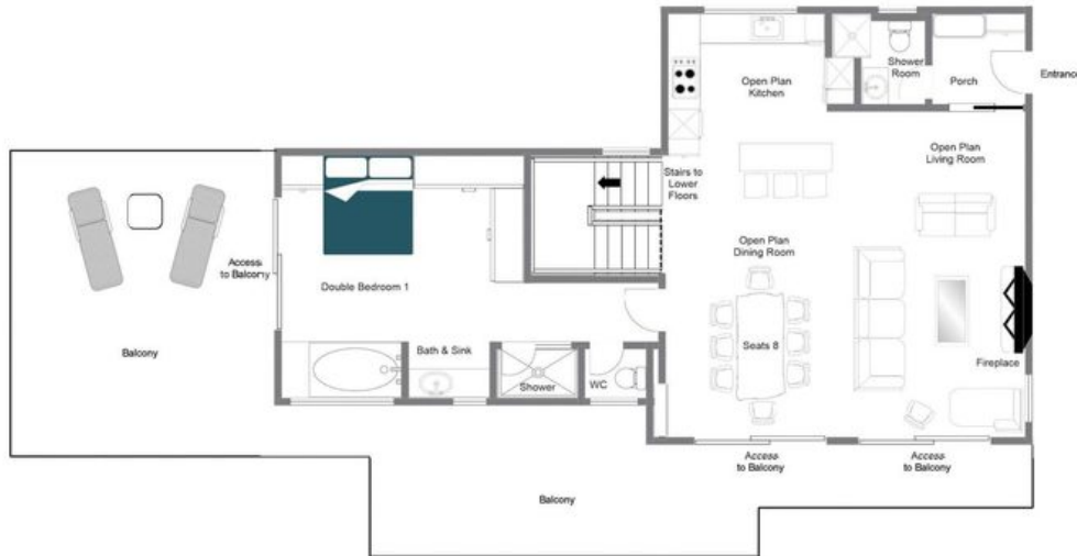
CHALET GRAND COEUR, FIRST FLOOR FOR ILLUSTRATION PURPOSES ONLY