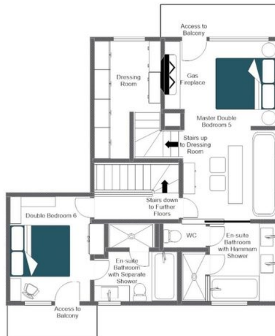
CHALET VICUNA, TOP FLOOR FOR ILLUSTRATION PURPOSES ONLY