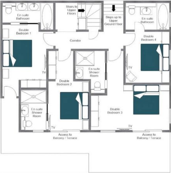
CHALET LA ROCHETTE, UPPER GROUND FLOOR FOR ILLUSTRATION PURPOSES ONLY