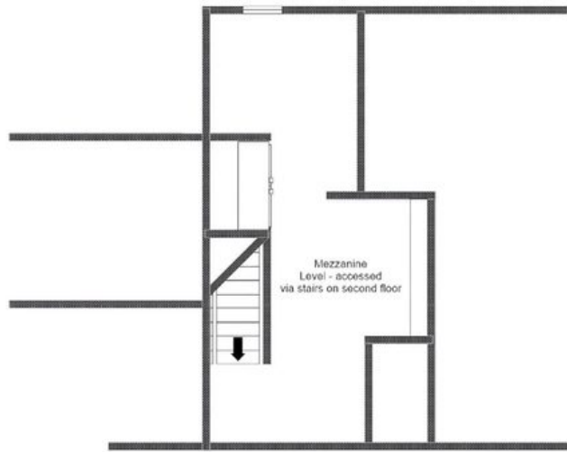
CHALET L'ORCHIDÉE, MERIBEL - THIRD FLOOR FOR ILLUSTRATION PURPOSES ONLY